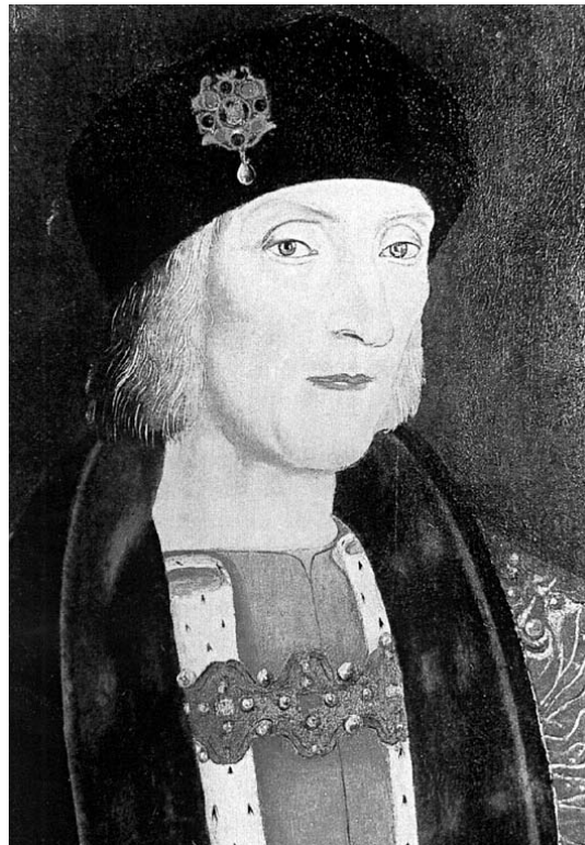
Firma autografa di Cristoforo Colombo, 7 luglio 1503 (Archivio delle Indie).

Per quanto riguarda specificatamente l'ampia bibliografia relativa alla tesi di Ge-