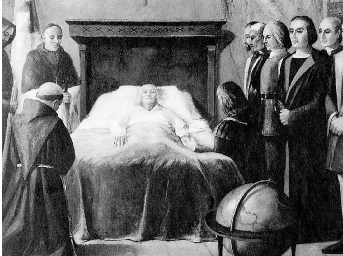
Cristoforo Colombo sul letto di morte. Il figlio Fernando in ginocchio, attorniato da amici e dal notaio della Corona (dipinto conservato nella casa museo di Valladolid).

vo del Grande Navigatore, spesso ipotizzato ma mai sicuramente dimostrato, forse già identificato nel Cristoforo Colombo risultante nel discusso "documento Assereto", sopraccitato.