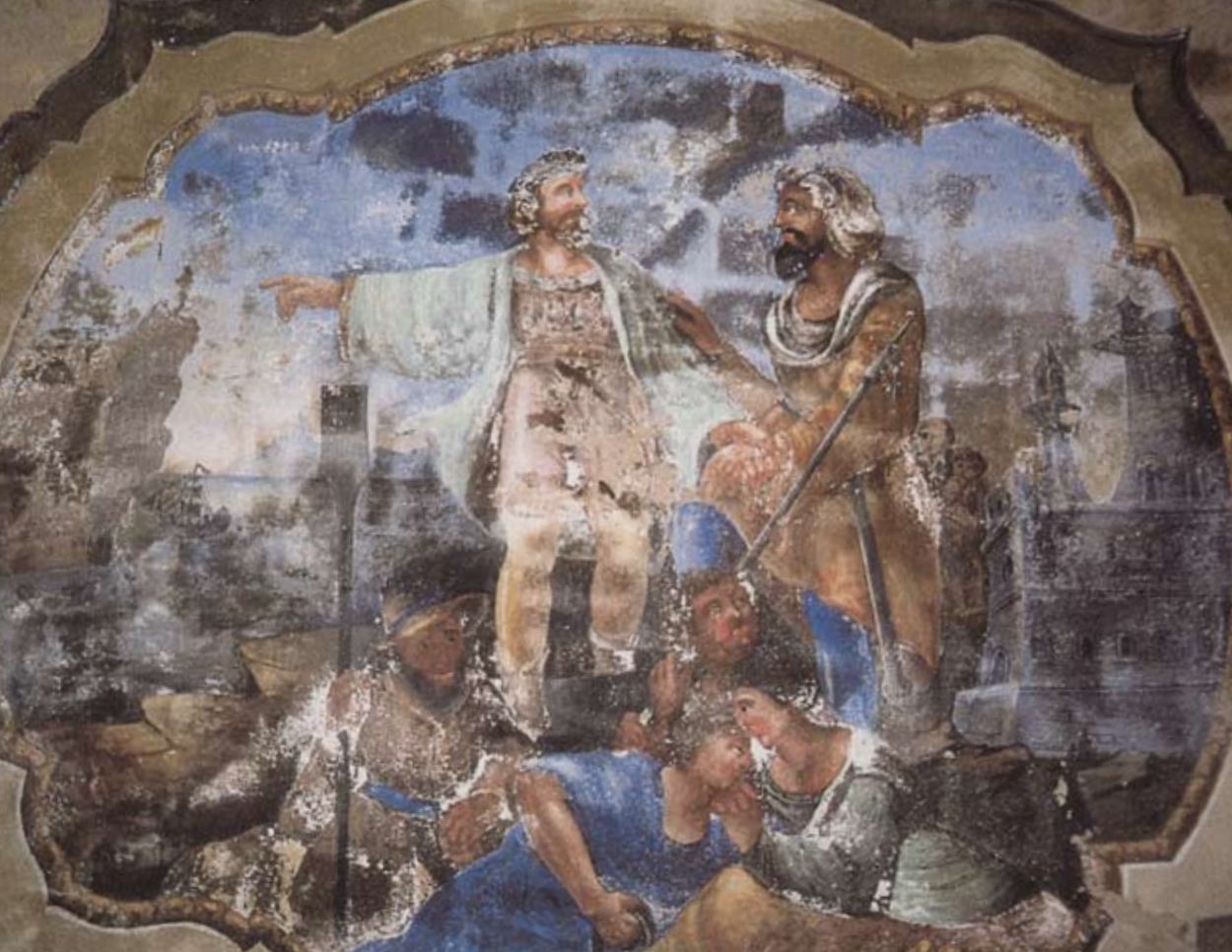
Cuccaro Monferrato. Affresco sulla volta di una sala del castello rappresentante lo sbarco di Cristoforo Colombo, circondato dagli indigeni e, sullo sfondo, le tre caravelle.

Madre, tutrice del Re Carlo II di Spagna, una supplica ove chiedeva di essere investito di un altro feudo in luogo della Giamaica, non recuperabile dagli inglesi.