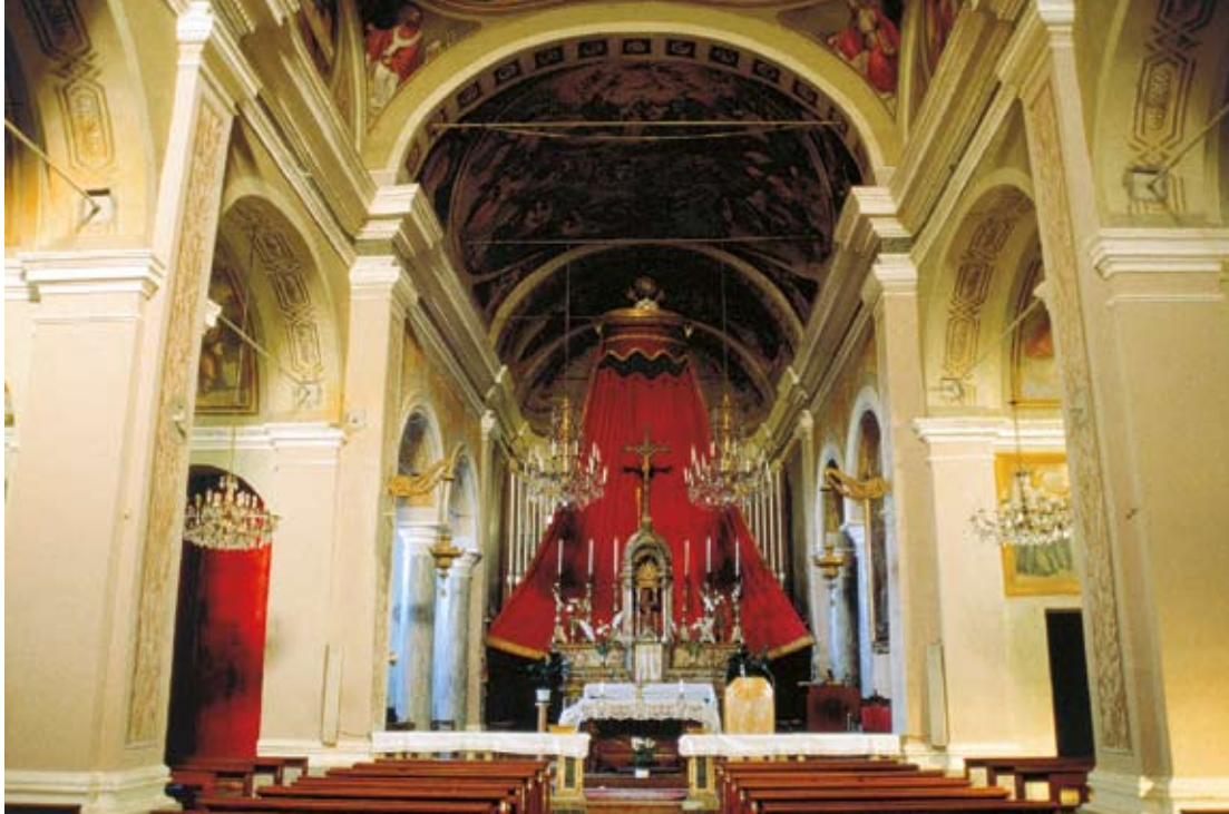
Interno della parrocchiale di Santa Maria Vergine Assunta.

Riguardo a Teodoro II Marchese di Monferrato, è necessario sottolineare che egli divenne signore della città di Genova nel 1409 e nel 1415 a seguito delle vittorie del condottiero Facino Cane, comandante delle truppe monferrine, sui Francesi. Teodoro, che era stato chiamato in città dalla parte Ghibellina capitanata dalle famiglie Spinola e Doria, governò di fatto Genova, riformandone le istituzioni, nella sua qualità di Vicario Imperiale.