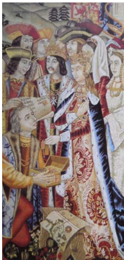
Particolari di un arazzo fiammingo del XVI secolo. A sinistra: la regina Isabella consegna a Colombo i suoi gioielli, perché siano dati in pegno finanziario per l'impresa delle Indie, al suo fianco Ferdinando d'Aragona. Al centro: il navigatore a corte al ritorno dalla scoperta, riceve dal re d'Aragona il cartiglio con la scritta "Almirante de Castilla". A destra: Colombo sale a bordo della Santa Maria nel porto di Palos.

te diretto in via femminile del Grande Cristoforo. Poiché il Marchesato di Giamaica, più cospicuo territorio del Maggiorasco, era stato occupato dagli inglesi a metà del XVII secolo, Don Pedro Colon, legittimo feudatario, non poteva più percepirne le rendite. Egli presentò pertanto nel 1671, alla Regina